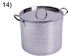
pot, cooking pot