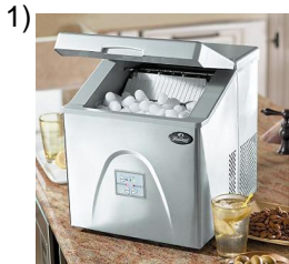
icemaker, portable cooler

Words to Match: la taza - cacerola - los trastes - el jabón - la escoba - las especias - el congelador - la servilleta - el cuchillo - la bandeja - la basura - la hielera - la cubeta - rico - las bolsas para basura - la copa - el vaso - la cuchara - la cocina - el litro - comal de barro - el platillo - la estufa - el cepillo - ollas - la olla - el horno - las almendras - tazón - rebanador - sartenes - el sabor