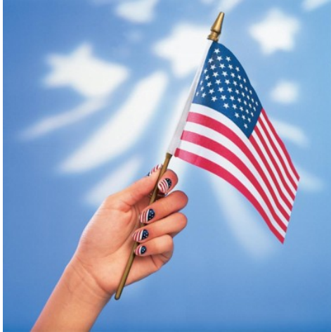
Fourth of July