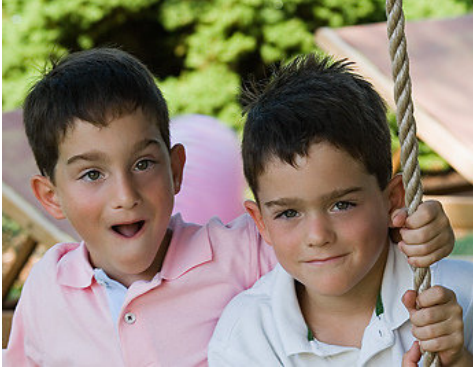
This is my friend (boy)