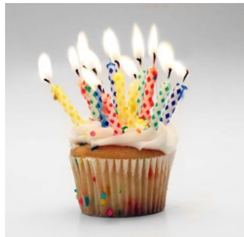
How old are you?