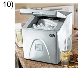
icemaker, portable cooler