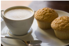
coffee with creme