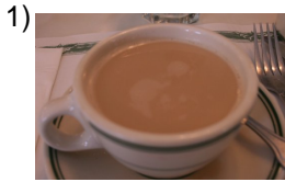
coffee with milk

Words to Match: té con crema - té con leche - zumo de naranja - agua mineral - coñac - agua embotellada - café con crema - el té - la bebida - jugo de naranja - café con leche - té - beber - agua gaseosa - la sed - licuados - tengo sed - una coca - agua con gas - jugo de piña - el corcho - café negro - jugo de tomate - té con leche y azúcar - los refrescos - refresco - té con crema y azúcar - café con crema y azúcar - café descafeinado - las bebidas - infusión - el jugo