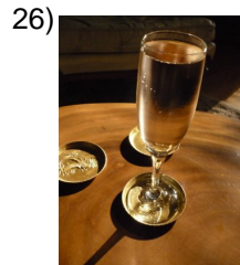
mineral water, sparkling water