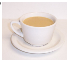
coffee with cream and sugar