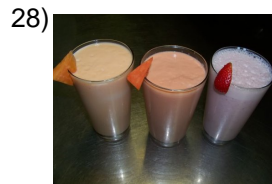
drink made from fruit