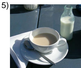
tea with cream