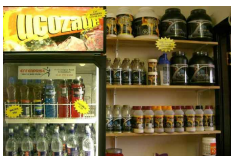
refreshments, soft drink