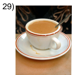
tea with cream and sugar