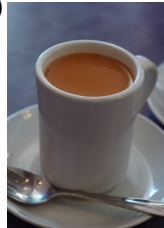
black tea with milk and sugar