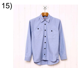
formal dress shirt