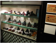
footwear, shoe shop