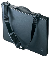
purse, pocket-book, portfolio